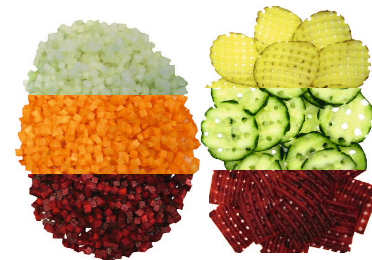
Würfel- und Brunoise-Schnitte

Die Option «Gourmet» beinhaltet einen speziellen Deckel mit 4 verschiedenen Möglichkeiten für das optimale Zuführen der Produkte. Inklusive einem Drehschacht für die dekorativen Schnitte «Brunoise» und «Gaufrettes».