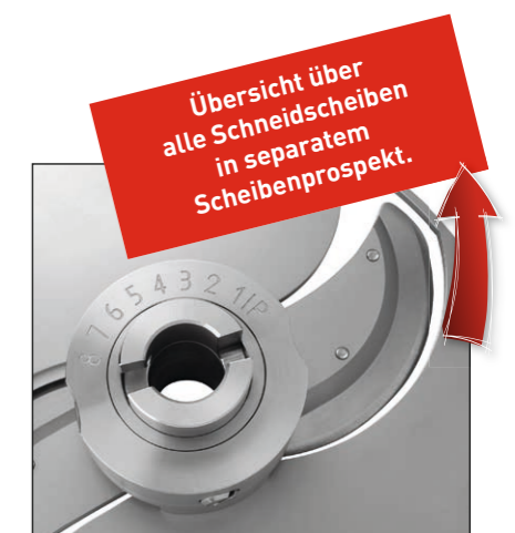
Einfaches Einstellen der Schnittstärke ohne Werkzeug.