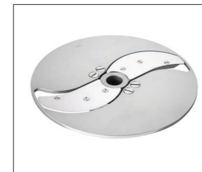
Verstellbare Scheibenschneidscheibe 0 – 8 mm mit ziehendem Schnitt