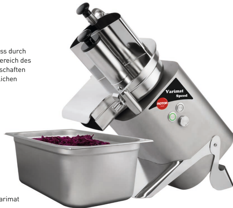
Optimal für GN-Behälter bis 200mm Höhe geeignet

Die Rotor Lips AG als Hersteller garantiert, dass der Varimat Speed den gesetzlichen Anforderungen entspricht.