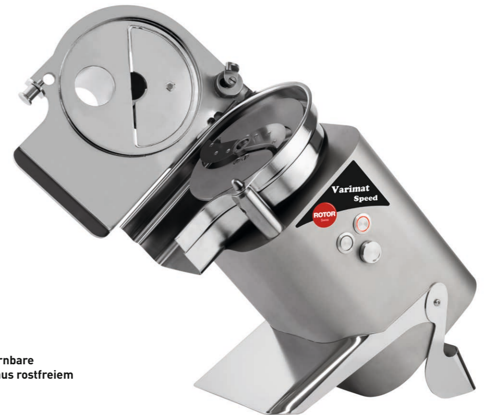
Gehäuse, Deckel und der entfernbare Schneidraum sind hergestellt aus rostfreiem Edelstahl