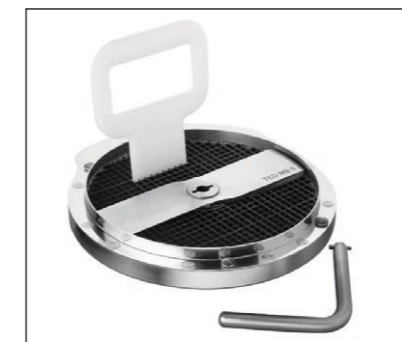
Würfeleinsatz mit Messer, Reinigungsstopfer und Messer-Entnahmewerkzeug

Die Scheibenschneidscheiben und Würfelmesser verfügen über zwei Klingen.